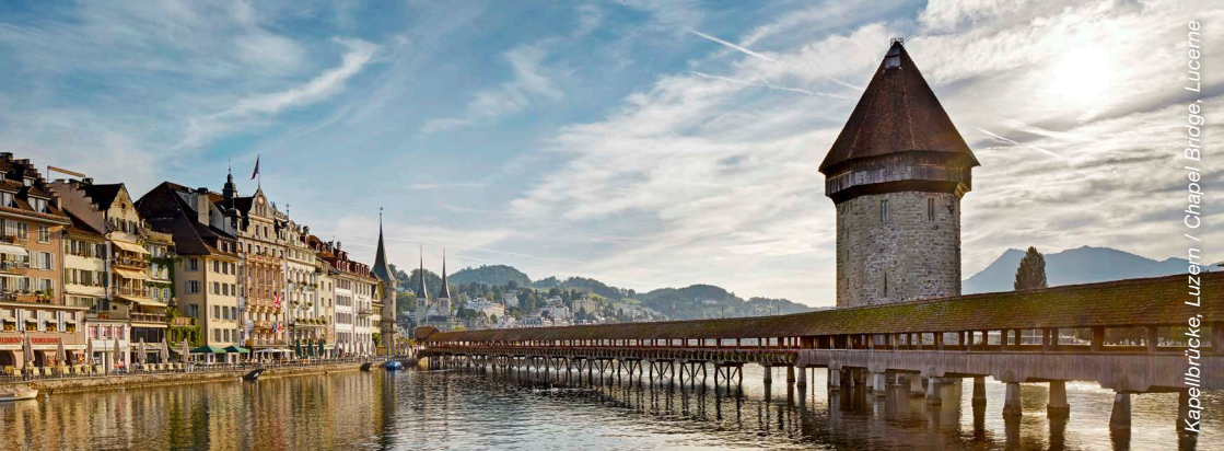
Kapellbrücke, Luzern / Chapel Bridge, Lucerne